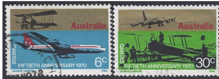
Avro 504 en Boeing 707