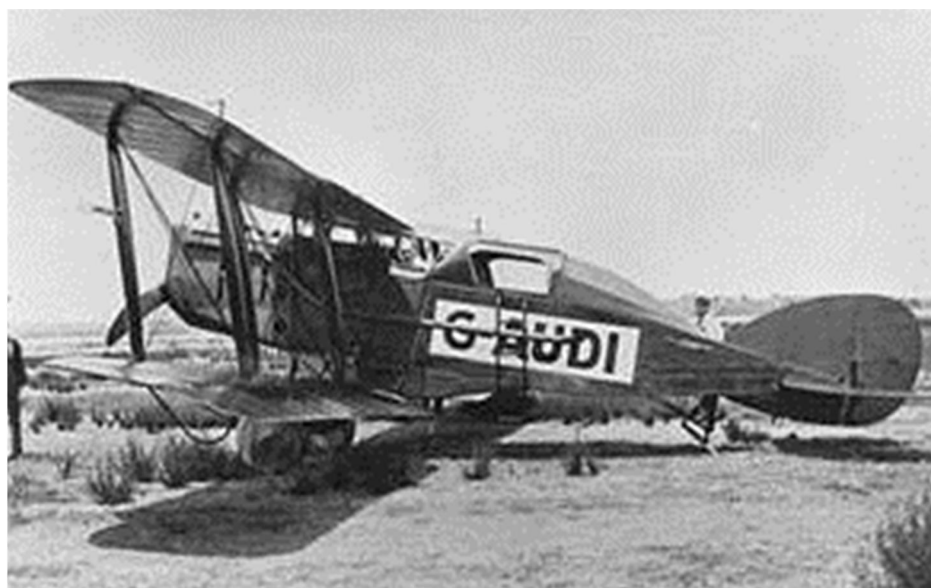
Bristol Tourer van Western Australian Airways

In 1921 verleende de regering van het Commonwealth een vergunning aan Brearley voor de eerste gesubsidieerde wekelijkse retourvluchten in Australië. Op 5 december 1921 begon zijn luchtvaartmaatschappij "Western Australian Airways" de eerste regelmatige retourvluchten tussen Geraldton en Derby over een afstand van \pm 2000 kilometer. Deze vluchten werden uitgevoerd met de Bristol Tourer. In 1924 werd de route uitgebreid tot Perth en in 1930 naar het noorden tot Wyndham.