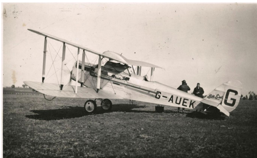
De Havilland DH 50

In 1925 werden de Bristols uitgefaseerd en vervangen door twee De Havilland DH 50 vliegtuigen welke 3 passagiers konden vervoeren.